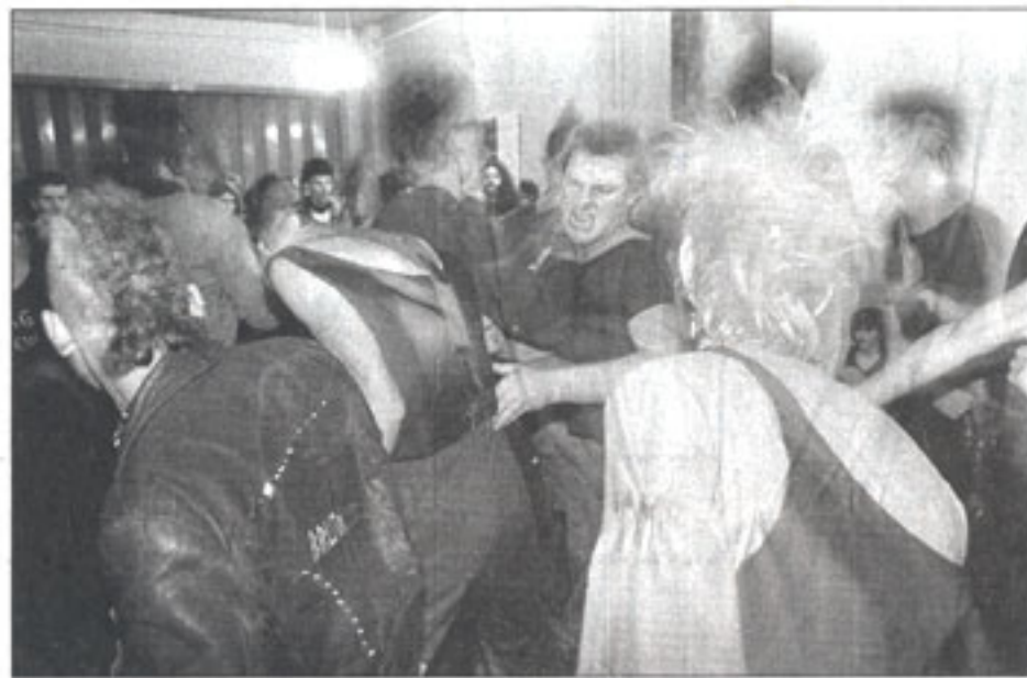
Punkkonzert in Karl-Marx-Stadt, 1985.

heute vorhält. Schwarzweiß ist nuancenreicher, lässt dem Betrachter mehr Räume für die eigene ergänzende (Farb-)Fantasie.