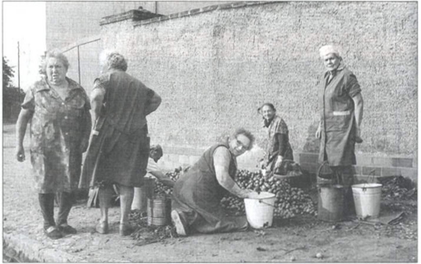
Beim Lesen der Kartoffeln, Torgau 1964.

Der 1954 in Radebeul bei Dresden geborene Hauswald braucht gelegentlich die Unauffälligkeit eines Chronisten, der seine Motive nicht inszenieren will. Am Anfang stand einer jener unregelmäßigen Lebensläufe, die die DDR eben auch hervorbrachte: 1970 Beginn einer Fotografenlehre, 1974 Abbruch der Ausbildung, Arbeit als Industrieanstreicher, Aufzugsmonteur, Gerüstbauer, Rocktechniker. Er zog mit den Bands durch das Land. Ungelernter Fotograf an der TU Dresden, 1976 Gesellenprüfung als Fotograf und wieder Rocktechniker, der fleißig seine Welt knipst. Natürlich schwarzweiß. Das war nur am Anfang eine Frage des technischen Materials, später schon eine Gesinnung, die bis